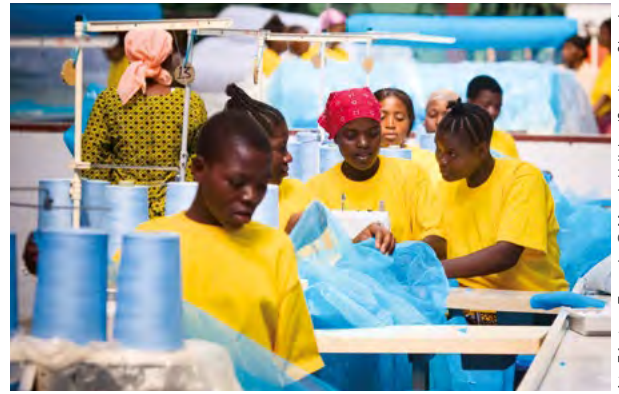
A to Z factory, Tanzania.

Lorsque des goulots d'étranglement nuisent à l'efficacité de la mise en œuvre, les pays peuvent décider de sous-traiter les achats. Parallèlement, ils doivent travailler à l'élimination de ces goulots d'étranglement. Les pays qui disposent de peu de temps ou de capacités limitées en ressources